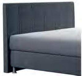
0320 Höhe 115 cm gegen Aufpreis