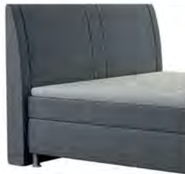
0050 Höhe 117 cm Standard