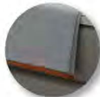
Typ 100 Plaid Klassik Kanten mit Einfassband paspeliert