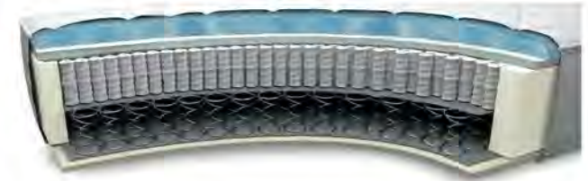
MA760GA gegen Aufpreis