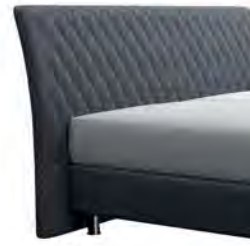
0354 Höhe 116 cm gegen Aufpreis