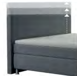
0300 Multimaß Höhe 70 - 125 cm in 5cm-Schritten kürzbar gegen Aufpreis