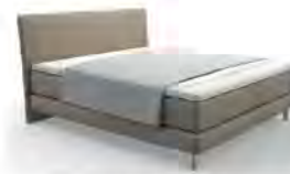
Typ 100 Plaid Klassik komplett geöffnet deckt die Liegefläche nicht ab.